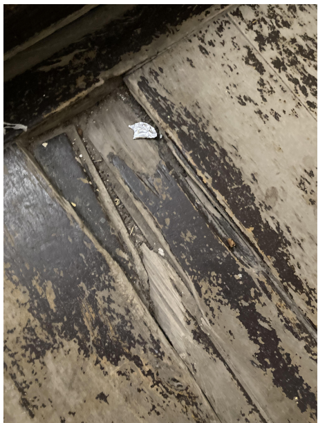
PROŠLAPÁNÍ VÝSTUPNÍCH A NÁSTUPNÍCH SCHODIŠŤOVÝCH STUPŇŮ + UŠTÍPNUTÍ STUPNIC - VÝMĚNA VIZ. POZNÁMKA